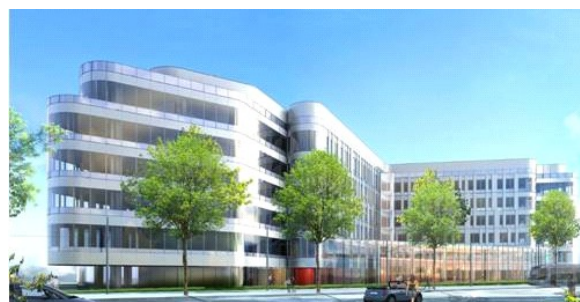
32 Grenier – 7 500 m 2 à Boulogne